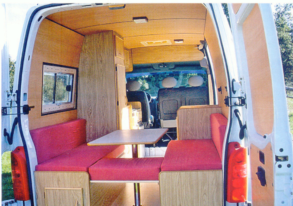
Un aménagement à prix canon, c'est possible. Il s'appelle Ecologis.

Tous les fourgons Savignat Roche reprennent trois principes fondateurs: une isolation de très haut niveau mariant trois matériaux différents et garantissant une utilisation "toutes saisons", des couchages de qualité (sommier à lattes pour les lits permanents, mousse Bultex pour les matelas et autres coussinages), et un mobilier soigné... le patron est ébéniste. Autre caractéristique de Savignat Roche, une politique de prix très étudiés. Le patron part en effet du principe que l'on peut se faire aménager un fourgon sans pour autant avoir de gros moyens. Ainsi, les aménagements de base sont proposés entre 9 194 € pour un Ecologis décliné sur Citroën Jumper et 23 500 € pour un Fontainebleau sur un Mercedes Sprinter.