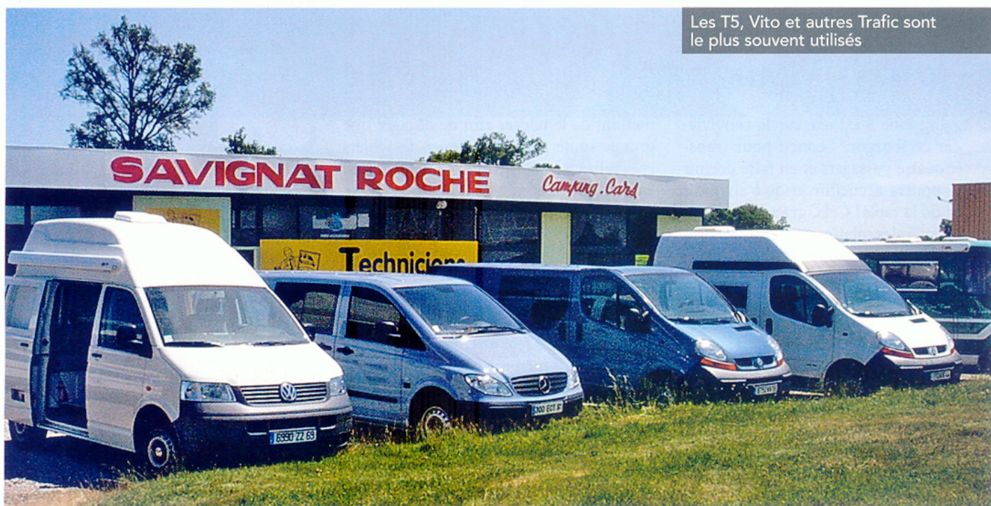
Les T5, Vito et autres Trafic sont le plus souvent utilisés

L a production de Christian Boullet est si bien adaptée aux désirs du client que l'on pourrait croire les modèles de base, figurant au catalogue, fabriqués sur mesure.