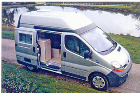
L'aménageur préfère les fourgons hauts faisant la part belle aux rangements.