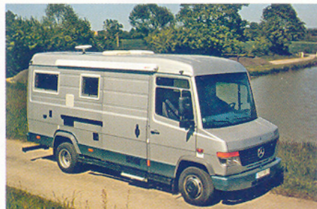
Dans la série "qui peut le plus, peut encore plus!", ce Mercedes poids lourd.